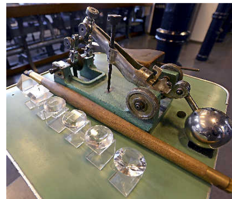
Hiermee werden diamanten gezaagd, met olijfolie en diamantpoeder.