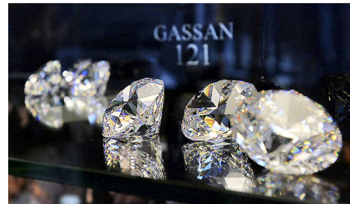
Display met voorbeelden van de Gassan 121.